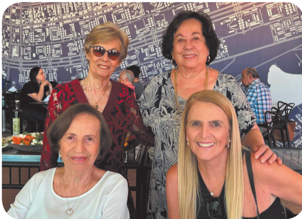
Yone com as amigas.