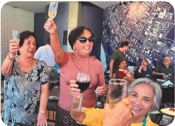
Na hora do brinde.

local que em tudo nos remete aos primeiros anos da nova capital.